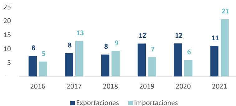
Gráfico N°3- Intercambio comercial Uruguay - países del Golfo – (Millones US$)

Fuente: elaborado por Uruguay XXI con base en datos de la DNA – Importaciones no incluyen petróleo.