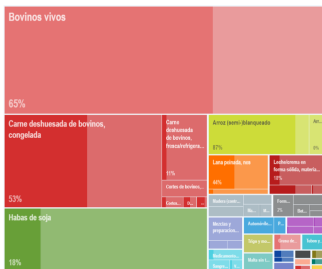
Figura 1 – Productos con Oportunidad de Exportación en la región